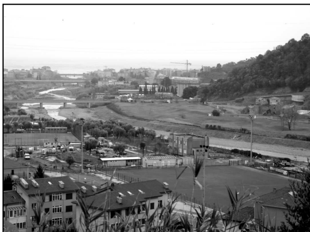
La Valle del Sansobbia